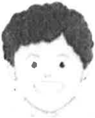
Espantado y nervioso